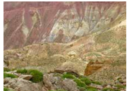
Beeindruckende Erdfarben im hohen Atlas