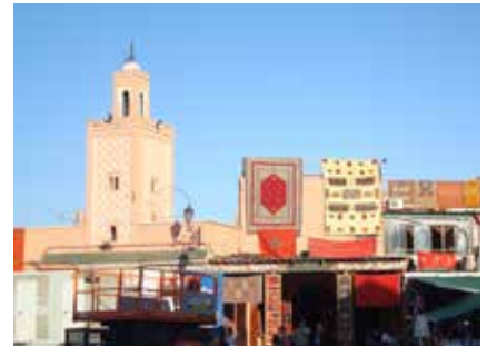
In der Medina von Marrakesch