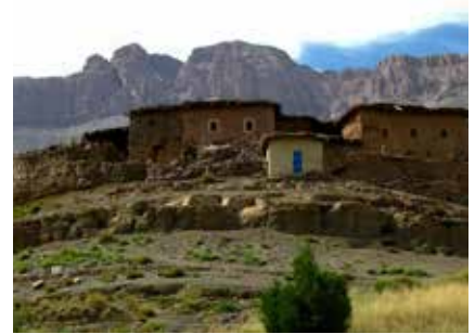
Berbersiedlung im Hohen Atlas

Können die Temperaturen in der Ebene um Marrakesch 40°C, östlich des Gebirges gar 50°C erreichen, ist es in den Bergen ab Höhen von 2000-2500 Meter warm bis angenehm kühl. Ist die Sonne verdeckt oder gar untergegangen kann es kalt werden, Nachtfrost auf Höhen ab 3500 Meter ist durchaus auch im Sommer üblich.