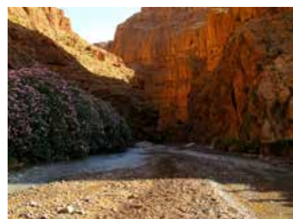
Im Tal der Rosen