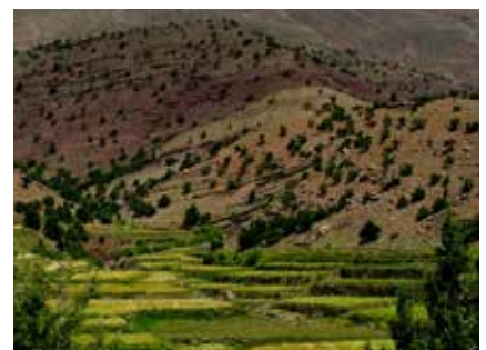
Das Farbenspektrum im hohen Atlas