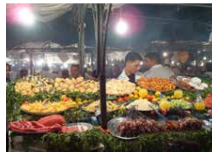
Marktstände mit frischen Speisen in Marrakesch