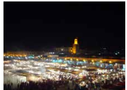
Der Djemma-el-Fna bei Nacht