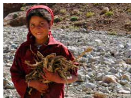
Berbermädchen beim Sammeln von Brennholz