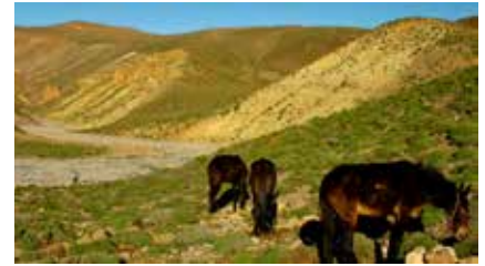
Eine wohlverdiente Pause für unsere Lastentiere

Kunden aus der Schweiz können unsere CHF-Kontoverbindung in der BTV Staad (Schweiz) spesenfrei nutzen.