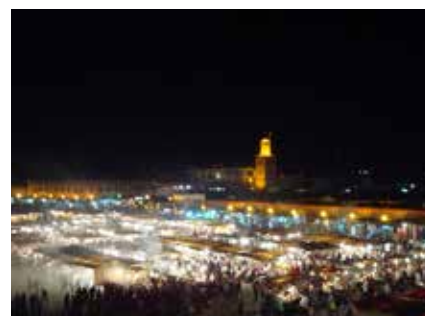
Marrakesch bei Nacht