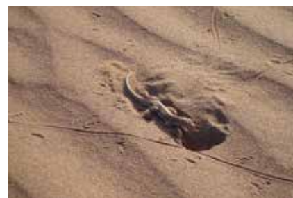
Die Wüste lebt