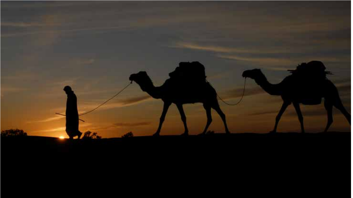
Sonnenuntergang in der marokkanischen Wüste