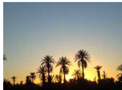
Sonnenuntergang in der Oase