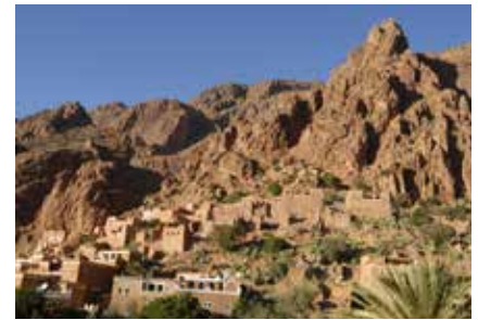
Lehmbauten in der Draa-Oase