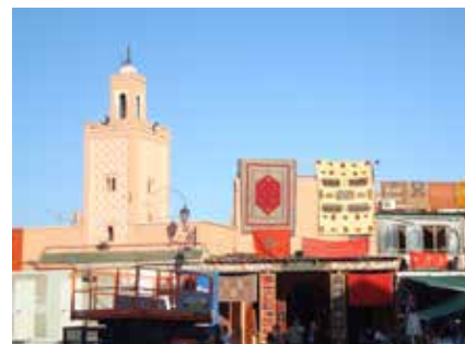
Straßenszene in der Medina von Marrakech