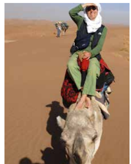
In der Wüste