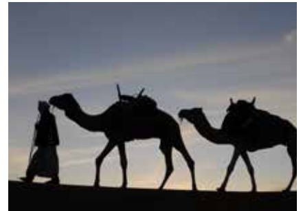
Lichtstimmungen am Abend