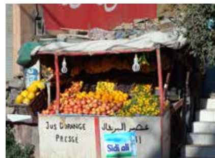
Hier gibt's frischen Orangensaft