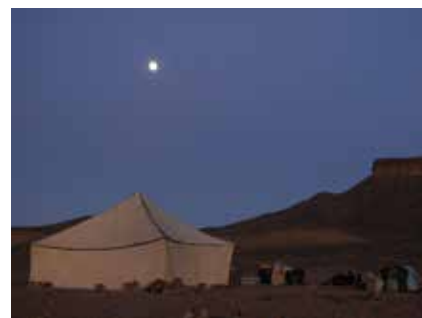
Das Camp bei Vollmond