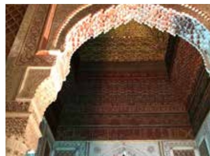
Palast in Marrakesch

Sie können bei den Geldwechselschaltern am Flughafen wechseln, in Marrakesch bleibt dafür aber auch noch ausreichend Zeit. In größeren Städten kann man auch am Bankomaten Geld beheben. Bitte prüfen Sie, ob Ihre Bankomatkarte fürs Ausland freigeschaltet ist (GeoControl). Der Kurs ist in ganz Marokko identisch.