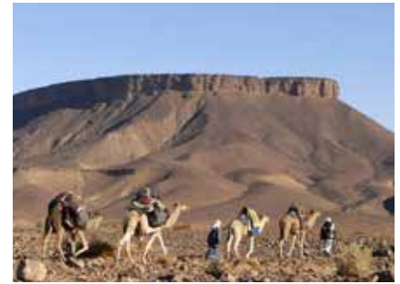
Dromedarkarawane in der Steinwüste

Sollte man unsicher sein, ob man den konditionellen Erfordernissen gewachsen ist, empfehlen wir die Miete eines Reitdromedars, auf das man sich bei Bedarf setzen kann. Ein Reitdromedar kann auch von mehreren Teilnehmern geteilt werden.