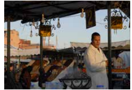
Am Djemma-el-Fna in Marrakesch