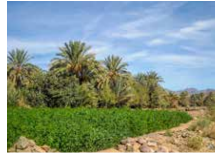
Unterwegs treffen wir auf üppige Oasen

Eine gute Kondition ist erforderlich und wird vorausgesetzt.