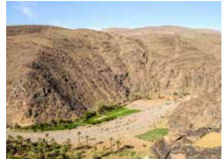
Blick auf eine Oase