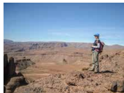
Weitblick über das Wüstengebirge