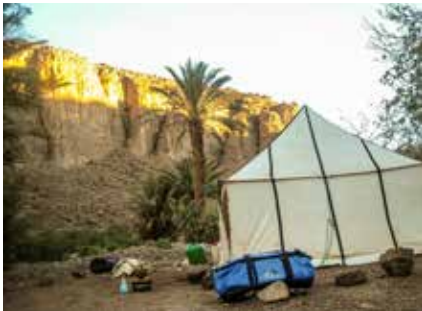
Sonnenaufgangsstimmung im Lager

Offizielle Währung in Marokko ist der Marokkanische Dirham, mit dem derzeitigen Kurs von ca. € 1,- = 11,- DH. Sie können bei den Geldwechselschaltern am Flughafen wechseln, in Marrakesch bleibt dafür aber auch noch ausreichend Zeit. In größeren Städten kann man auch am Bankomaten Geld beheben. Bitte prüfen Sie, ob Ihre Bankomatkarte fürs Ausland freigeschaltet ist (GeoControl). Der Kurs ist in ganz Marokko identisch.