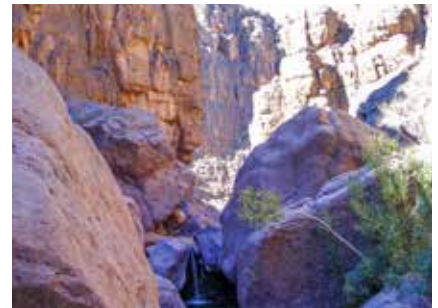
Durch die Schluchten des Djebel Saghro

Bitte beachten Sie, dass am Abend die Temperaturen merklich sinken und eine warme Jacke durchaus benötigt wird.