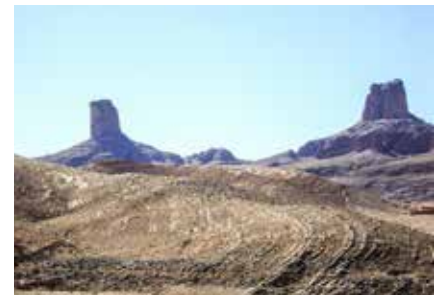
Die Zwillingstürme von Bab n'Ali

Am besten bereiten Sie sich mit regelmäßigem Ausdauersport (Joggen, Schwimmen, ausgedehnte Berg- und Wandertouren) im Vorfeld der Reise vor. Bitte bedenken Sie, dass sich im Laufe der Tage die Anstrengungen aufsummieren.