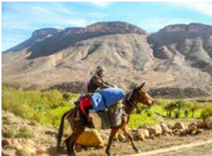
Einer unserer Begleiter auf seinem Reittier

Bitte trinken Sie niemals Wasser aus dem Wasserhahn, einem Brunnen oder Bach, ohne es vorher zu entkeimen (z.B. mit Micropur), oder abzukochen. Zähneputzen ist in der Regel kein Problem. Achten Sie beim Kauf von Mineralwasser darauf, dass der Verschluss intakt ist.