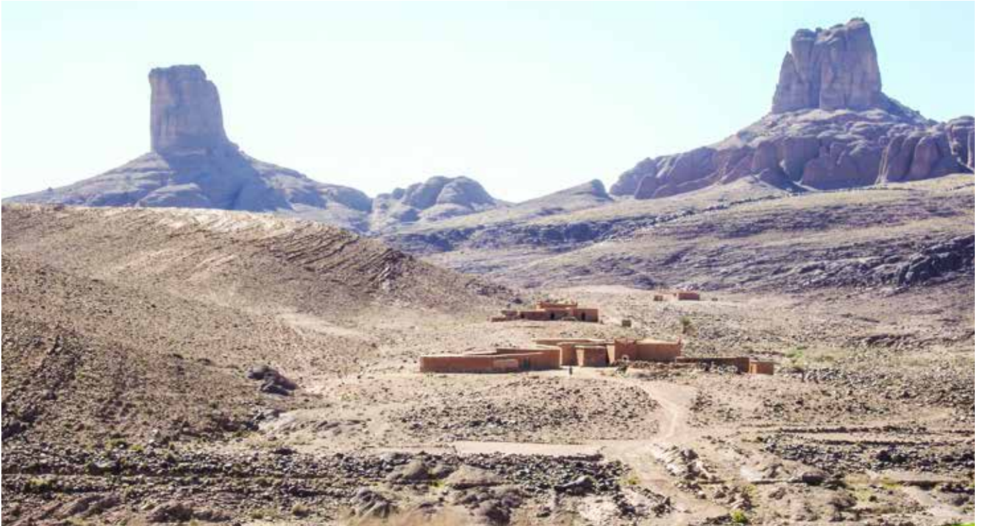
Die Zwillingstürme Bab n'Ali