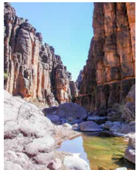
In den Schluchten des Saghro