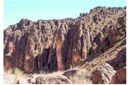
Das Urgestein des Djebel Saghro