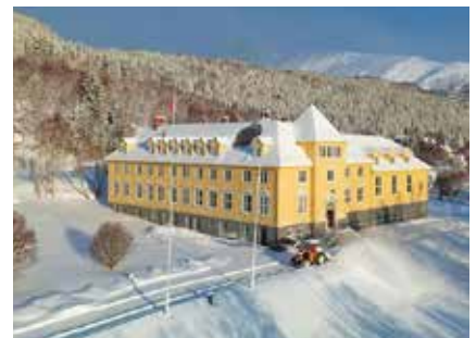
Solvov-Castle in Lyngseidet