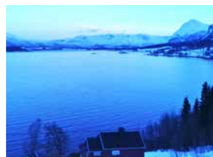
Abendlicher Ausblick von der Lodge