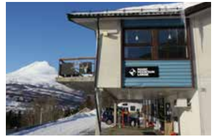
Magic Mountains Lodge in Lyngseidet

Im Norden von Norwegen bestehen auch im März noch gute Chancen, Nordlichter beobachten zu können. Die besten Voraussetzungen sind kaltes, trockenes Wetter und ein klarer Himmel!