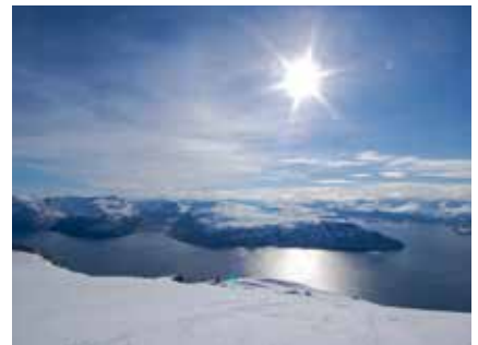
Die Lyngen Alps von oben