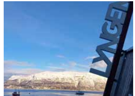
Sonnenuntergangsstimmung im Fjord