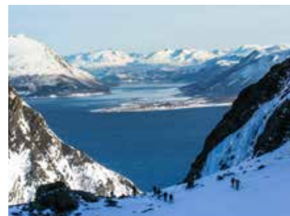
Gewaltige Tiefblicke in den Lyngen Alps

Nachdem Norwegen kein EU-Mitglied ist, kann nicht mit Euro gezahlt werden. Offizielle Währung in Norwegen ist die Norwegische Krone, mit dem derzeitigen Kurs von ca. 1,-€ = ca. 11 NOK. Wir empfehlen die Mitnahme einer Kreditkarte oder (ev. Bankomatkarte - wird u.U. nicht überall akzeptiert). In Norwegen wird fast alles mit Karte bezahlt! Bargeld wird teilweise nicht oder nur ungern akzeptiert!