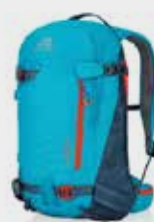
Targhee 26 L

Falls Sie einen Airbag Rucksack (ABS) mitnehmen möchten, informieren Sie uns bitte rechtzeitig, damit wir diesen bei der Fluglinie anmelden können. Planen Sie für den Check-In und die Security Kontrollen aber trotzdem etwas mehr Zeit ein.