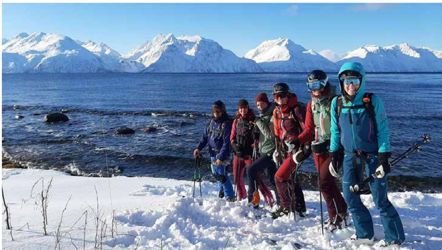
Abfahrt bis zum Meer - in den Lyngen Alpen

Traumhafte Skitouren in den berühmten Lyngen Alpen in Norwegen