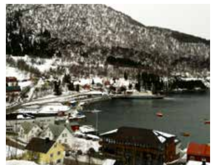
Blick auf Lyngseidet