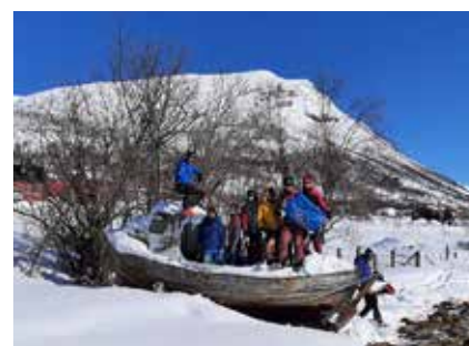
Ende der Skitour