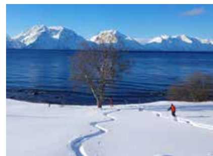
Pulverabfahrten bis in den Fjord