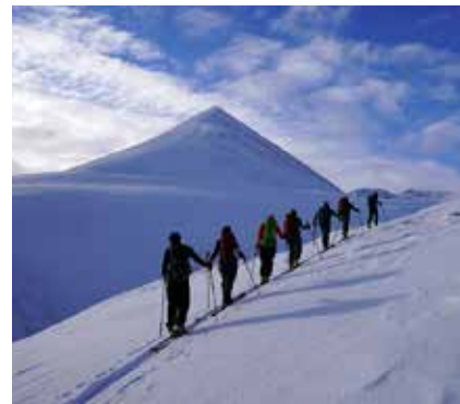
Skitour auf den Kvalvikfjellet

Die Mitnahme von Steigeisen und Haarscheisen sowie Erfahrung damit wird erwartet.