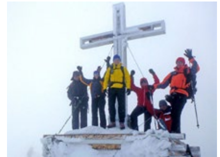
Am Gipfel des Großvenedigers

Aufstiege bis maximal 1450 Höhenmetern pro Tag, meist weniger. Abstiege bis maximal 1600 Höhenmeter pro Tag, meist weniger. Die Gehzeiten betragen bis zu maximal sieben Stunden pro Tag. Eine gute Kondition ist erforderlich und wird vorausgesetzt.