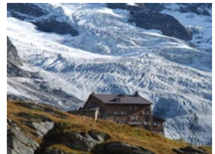
Die Warnsdorfer Hütte

In der Halbpension inkludiert ist ein mehrgängiges Menü, à la Carte Bestellung ist in diesem Fall zum Abendessen nicht möglich. Zum Frühstück gibt es Tee oder Kaffee und ein kleines Buffet. Heißes Wasser für einen Marschtee steht ebenfalls (evtl. gegen einen kleinen Betrag) zur Verfügung.