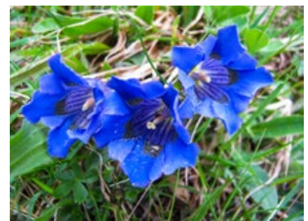
Enziane am Wegrand

Vegetarische Verpflegung ist möglich, bitte dem Bergwanderführer zu Beginn der Tour mitteilen.