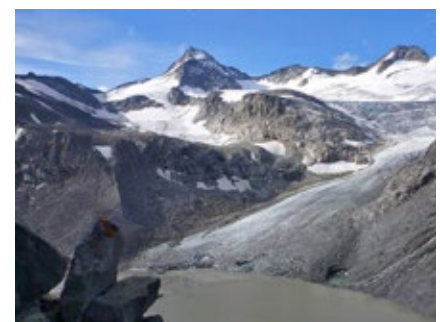
Die Gipfelpyramide des Venedigers