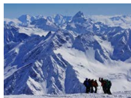
Akklimatisierungstour am Cheget