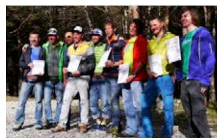
Verteilung der Gipfelurkunde in Terskol