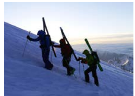
Erste Sonnenstrahlen beim Aufstieg