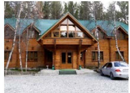
Unsere Unterkunft in Terskol