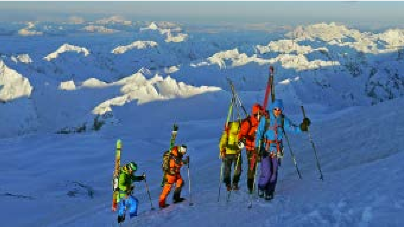
Sonnenaufgang über dem Kaukasus, im Aufstieg zum Elbrus

Skibesteigung des höchsten Gipfels Europas (5642 m)