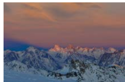
Sonnenaufgang im Kaukasus