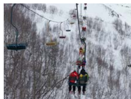
Am russischen Sessellift