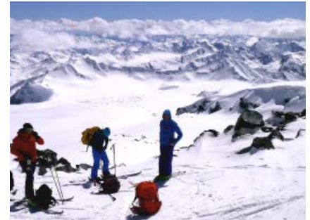
Akklimatisierungsskitour zu den Pastukhov-Felsen