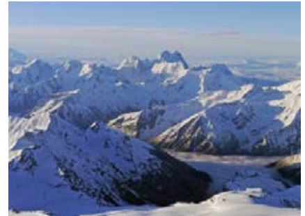
Kurz unter dem Gipfel

Denken Sie daran, dass die Ausstellung des Visums einige Zeit in Anspruch nimmt und die Beantragung des Visums deshalb rechtzeitig vor Reiseantritt erfolgen sollte. Das Visum kann frühestens 3 Monate vor Abreise beantragt werden.