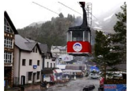
Die alte Gondelbahn in Terskol