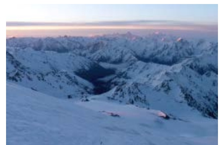
Frühmorgentliche Stimmung am Gipfeltag