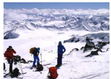
Akklimatisierungsskitour zu den Pastukhov-Felsen