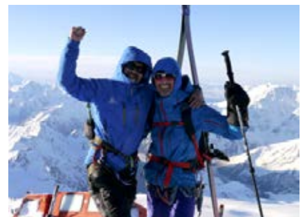
Akklimatisierung auf 5000 Meter

Eine Bezahlung Ihrer Flugreise mit Kreditkarte ist spesenfrei nach vorheriger Absprache mit Clearskies möglich. Wir benötigen Ihre Kreditkartendaten VOR Ticketausstellung, da der Flug nachträglich nicht mehr über die Kreditkarte abgebucht werden kann.