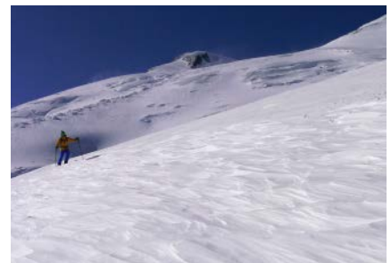
Wechselnde Schneebedingungen am Elbrus

Snacks, Schokolade, Riegel usw. sind nicht inkludiert und müssen von den Teilnehmern selbst mitgebracht, bzw. können zum Teil vor Ort gekauft werden.